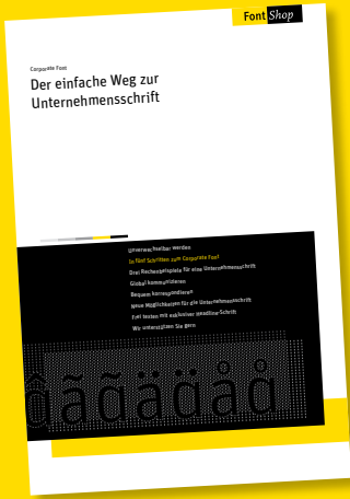
XI 0404 Der einfache Weg zur Unternehmensschrift kostenlos

Unsere neue Corporate Font Broschüre enthüllt: In fünf Schritten sind Sie am Ziel. Wie wir Sie im Detail unterstützen können, zeigen individuelle Praxisbeispiele. Die durchschnittlichen Lizenz- und Modifikationspreise geben eine erste Orientierung für Ihre Budgetplanung. Entdecken Sie neue Möglichkeiten für Ihre Unternehmensschrift ... und natürlich den richtigen Partner. Sofort downloaden unter: www.fontshop.de/einfacherweg.pdf